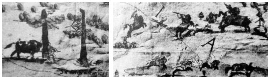
Илл. 3: Сцены охоты на тура на карте А. Вида и И. Ляцкого (гравюра 1555 г.). 24

2.2 Менее известны сцены охоты на тура , первая из которых появляется, по-видимому, на карте Антона Вида и Ивана Ляцкого 1542 г. (описание см. выше), которая также создавалась по заказу Герберштейна и дошла до нас в двух гравюрах на меди: 1) 1555 г. (Илл. 3) — издана Миховым, который обнаружил её в бывшей библиотеке Хельмштеттского университета (Michow 1906: 49; в настоящее время о местонахождении оригинала этой гравюры нигде не сообщается); 2) 1570 г. Франциска Хогенберга (Илл. 4), отличающаяся от первой, в том числе в сценах охоты на тура, — также издана Миховым, но ранее гравюры 1555 г. (об отличиях двух версий карты А. Вида и И. Ляцкого см. также: Кудрявцев 2017: 42).