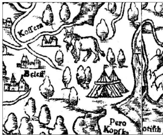
Илл. 8: Изображение предположительно сайгака на карте Московии в «Космографии» Себастьяна Мюнстера 1544 г. 28

Другое изображение сайгака предположительно обнаруживается на ещё более ранней карте — из «Космографии» Себастьяна Мюнстера 1544 г., который мог пользоваться картой А. Вида и И. Ляцкого. В данном же случае источником появления изображения странного животного, более похожего на козла (Илл. 8), исследователи называли описание не Герберштейна, а Матвея Меховского (Матвей Меховский 1936: 214 — со ссылкой на Е. Замысловского).