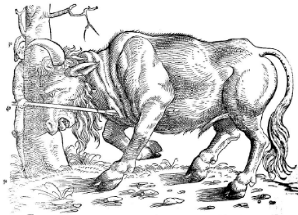
Илл. 5: Сцена охоты на тура в первом издании « Historiae Animalium » К. Геснера. 26

иконографически соответствует более поздней гравюре 1570 г.: бык движется справа налево навстречу дереву, за которым прячется охотник ( Илл. 5 ), тогда как на более ранней гравюре 1555 г. бык движется слева направо и ниже имеется ещё одна сцена охоты — без дерева. Кроме того, у Геснера отсутствует второе дерево со вторым охотником — лучником.