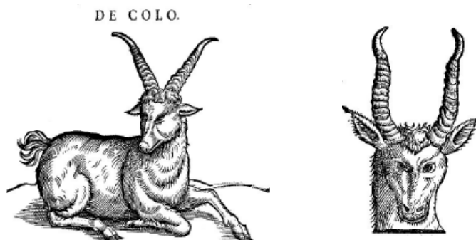
Илл. 7: Два изображения сайгака во втором издании « Historiae Animalium » К. Геснера. 27

2.4 Если в первом издании « Historiae Animalium » К. Геснера статья «De Colo (о сайгаке)» ( Conradi Gesneri Historiae Animalium. Lib. I. P. 393 ) осталась без иллюстраций, то во втором, франкфуртском, их появляется сразу две: лежащий зверь целиком и отдельно его голова (Илл. 7).