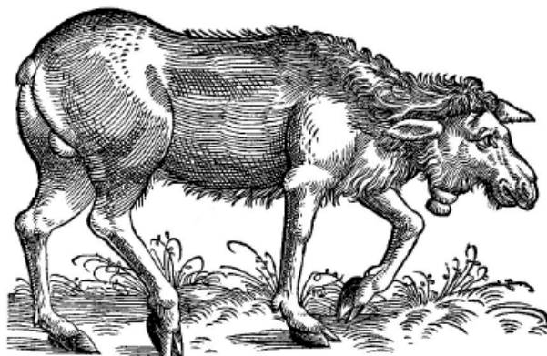
Илл. 6: Лось в первом издании « Historiae Animalium » К. Геснера ( Ibid. P. 1).

2.4 Если в первом издании « Historiae Animalium » К. Геснера статья «De Colo (о сайгаке)» ( Conradi Gesneri Historiae Animalium. Lib. I. P. 393 ) осталась без иллюстраций, то во втором, франкфуртском, их появляется сразу две: лежащий зверь целиком и отдельно его голова (Илл. 7).