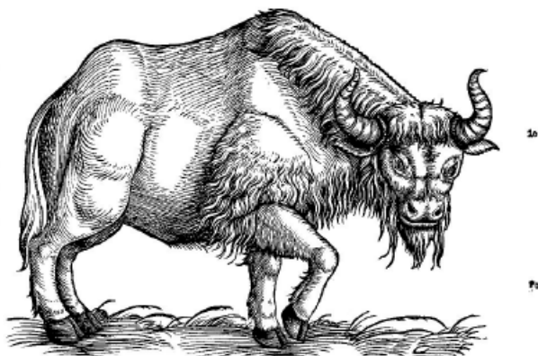
Илл. 1: Зубр в приложении к первому изданию «Historiae Animalium» К. Геснера. 23

BISON. Germanice Wisent. De quo ea tantum cognovimus, quæ iam inter cætera de Vro scripta sunt.